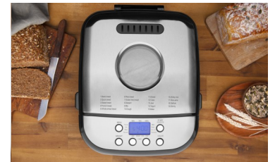
SICHTFENSTER ZUR KONTROLLE DES BACKVORGANGS