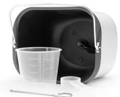
BROTBÄCKFORM + KNETHAKEN MIT SOL-GEL-ANTIHAFTBESCHICHTUNG, INKL. MESSBECHER + MESSLÖFFEL