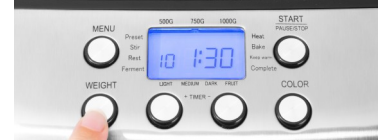
19 PROGRAMME: BROT, TEIG, MARMELADE, JOGHURT, KUCHEN, DESSERT, ANRÖSTEN UND REISWEIN