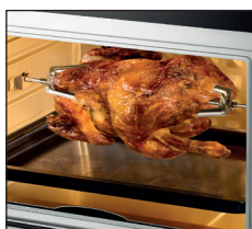
Drehspieß mit Halteklammer