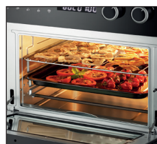
Aufwärmen und Dören