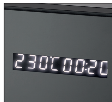
Einstellbare Temperatur von 40° C bis 230 °C