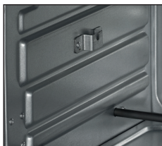
3 nutzbare Garebenen