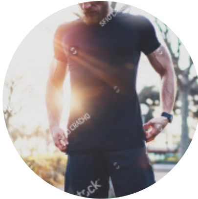
Muskeltraining durch EMS