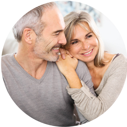
Schmerztherapie durch TENS

Die Reizstrombehandlung ermöglicht eine schmerzunterdrückende Wirkung. Dies hat oft zur Folge, dass zum Beispiel der Bedarf an Schmerzmitteln gesenkt werden kann. Bei richtiger Anwendung gilt die Behandlung mit einem TENS-Gerät als schmerzfrei, nebenwirkungsarm und risikolos. Praktisch ist auch, dass die Behandlung mit kleinen, akku- oder batteriebetriebenen TENS-Geräten auch flexibel und individuell nach Bedarf zu Hause erfolgen kann – wann immer Sie wollen.